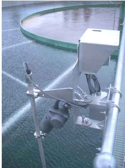
Kuva yllä: SULTAN ORCA - selkyettimien ja sakeuttimien lietepintamittaus Kuva ylhäällä vasemmalla: SULTAN AWR234 - erillisjärjestelmä Kuva vasemmalla: SULTAN 2 - kompaktipintalähtettä

SULTAN P - liikkuvan kohteen kosketuksettomaan asemointiin Master-Slave -periaatteella. Maks. 190 m:n toimintaväli. Ulostuloviestin siirto liikkuvasta kohteesta "akustisessa" muodossa.