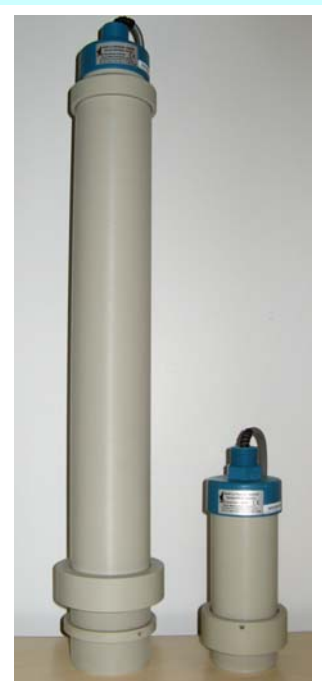
Kuva: Akustinen mäntä, 5 kHz ja 30 kHz

SULTAN-sarja: SULTAN 2 SULTAN 234 SULTAN P SULTAN S SULTAN FLOW ORCA LIQUID