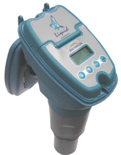
LIQUID-sarja Edullinen, kompakti 2-johdinpintalähtetin nesteille

Nimensä mukaisesti LIQUID soveltuu vain neste-pintojen korkeuden mittaamiseen lyhyehköillä mitta-usmatkoilla (alle 10 m) hyvissä tai kohtuullisissa olosuhteissa.